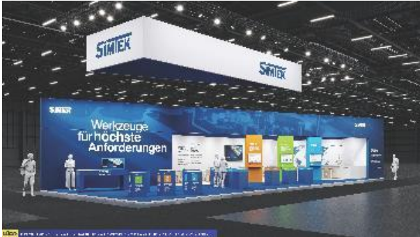
Bild 1: Messestand SIMTEK

BU: SIMTEK auf der AMB in Halle 3, Stand C36: Erstmals präsentieren die Experten aus Mössingen der Fachöffentlichkeit ihr Werkzeugsortiment mit 3D-gelaserten Spanformgeometrien. Eine große Auswahl ist ab sofort auch über den neuen Hauptkatalog erhältlich.