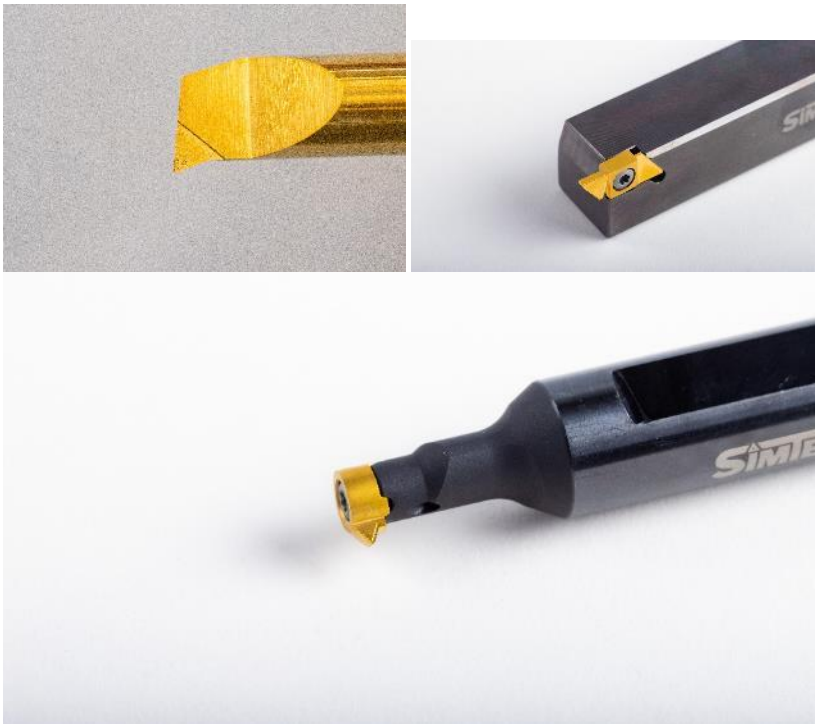
Bild 3-5: simturn AX, KX, DX mit gelasierter Spanformgeometrie

BU: Für verbesserte Spankontrolle und erhöhte Prozesssicherheit: Komplexe 3D-gelaserte Spanformgeometrien jetzt auch im Standardsortiment der simturn Werkzeugfamilie und somit Teil des neuen SIMTEK-Hauptkatalogs.